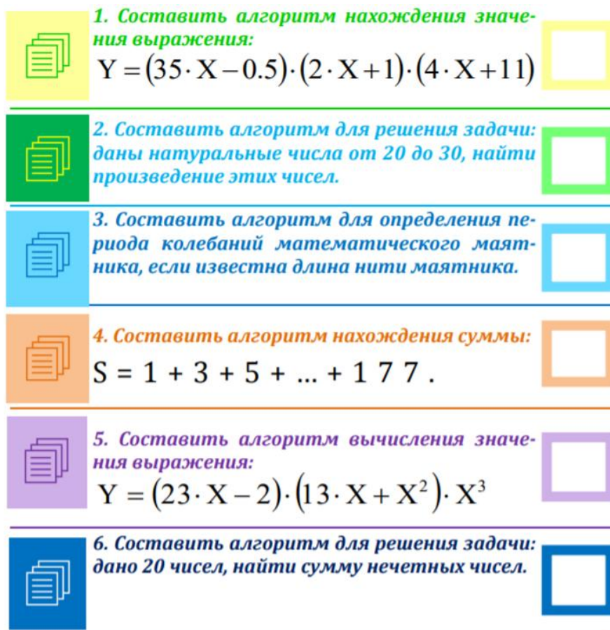
Рисунок – Образец задания

В текстовом редакторе создайте документ, включая все рисунки, формулы, учитывая особенности форматирования. Выполните следующие установки: поля: верхнее – 1,5 см, нижнее – 1,5 см, левое – 2,5 см, правое – 1,5 см; междустрочный интервал – одинарный; абзацные отступы и выступы, если в этом есть необходимость. Подберите подходящий тип и размер шрифта, максимально соответствующий образцу.